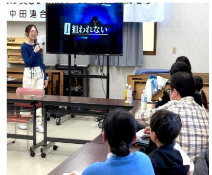
三石さんの話しを聞く参加者

「レイの失踪」は、動画配信者レイが失踪するところからストーリーは始まります。参加者はレイの仲間の立場で、彼女の SNS での投稿やメッセージのやり取りを分析し、彼女の身に起こったことを探っていく中で闇バイトに陥る危険性や恐怖を疑似体験できる教育プログラムです。