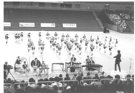
全国大会本番での演奏